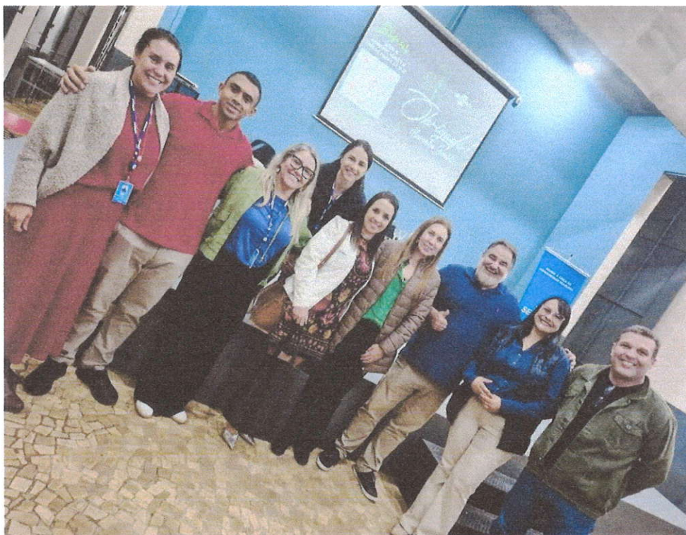
Dia 23/07/2025 Palestra: "Instagram para negócios" do Projeto Empreenda Tur: