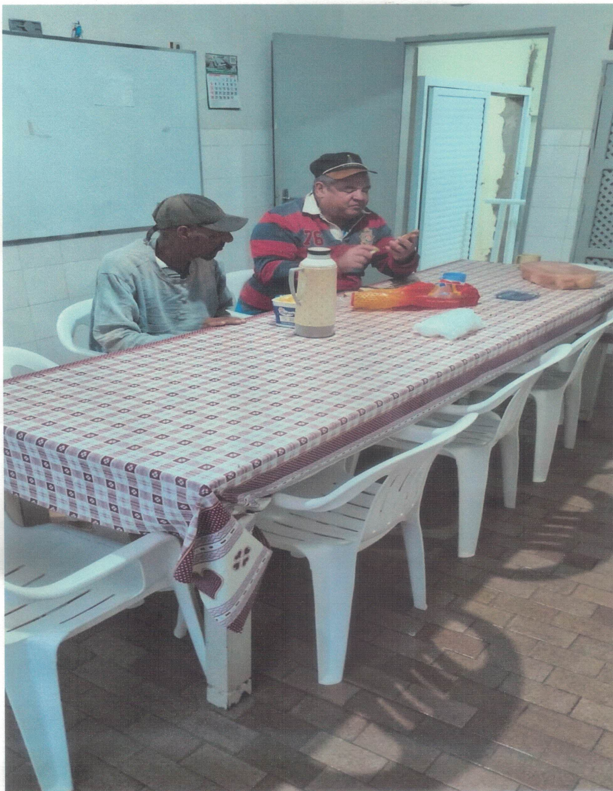
FOTO ALBERGUE NOTURNO JOSÉ PEREIRA DA SILVA PRADO PROGRAMA DE ATENDIMENTO AO ITINERANTE