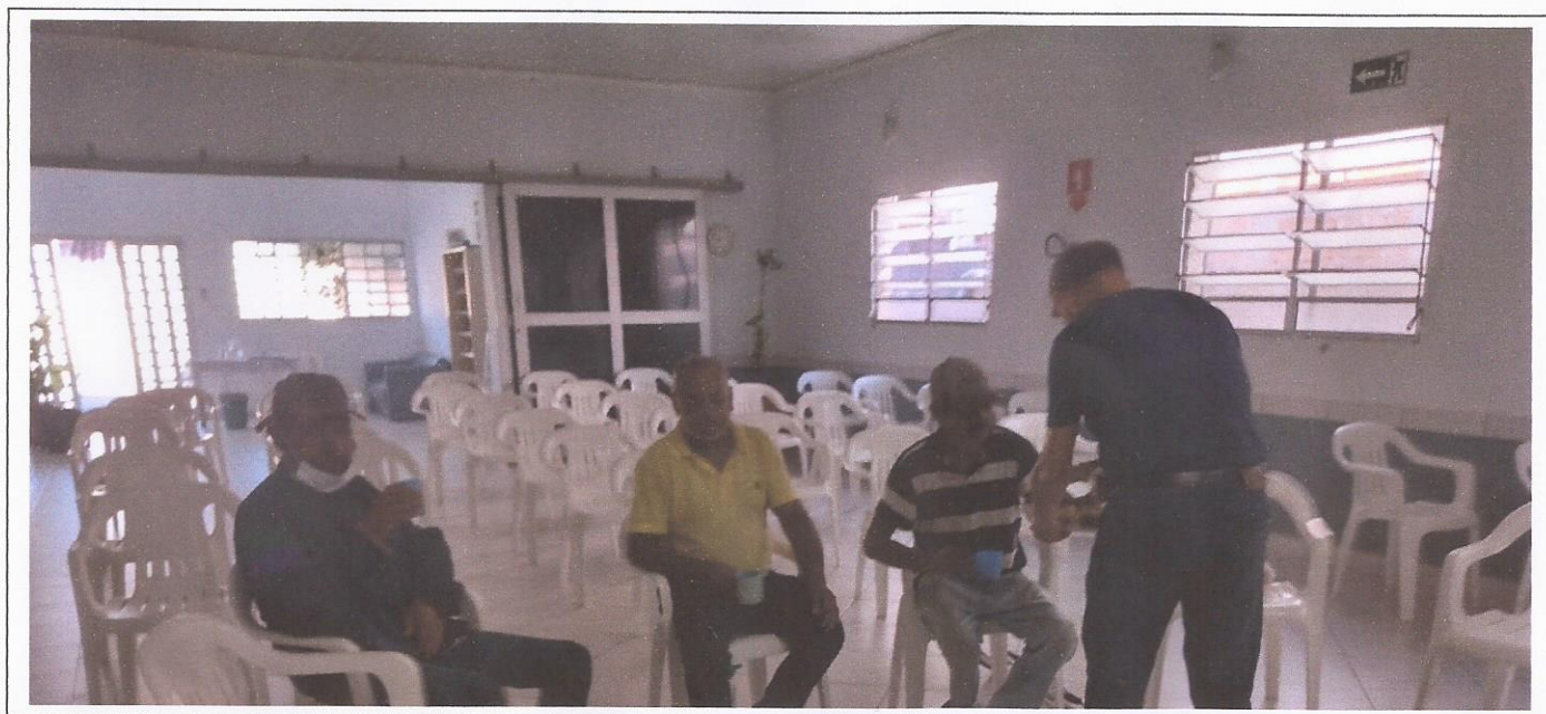
PROJETO CAFÉ DA MANHÃ NO ALBERGUE USUÁRIO EM TRATAMENTO CASA DIA STA.RITA P.QUATRO