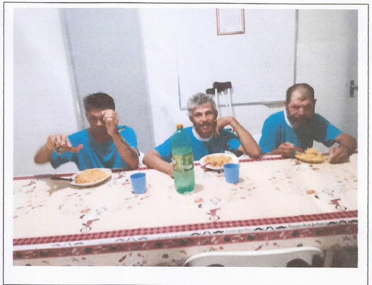
FOTO PROJETO CAFÉ DA MANHÃ NO ALBERGUE USUÁRIOS EM TRATAMENTO –CASA DIA STA.RITA P.QUATR40